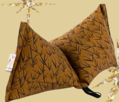
DIAGRAM EDITIONS, nos plus belles images sont pour vous.

COUSSINS ZENITUDE, votre bien-être au naturel.